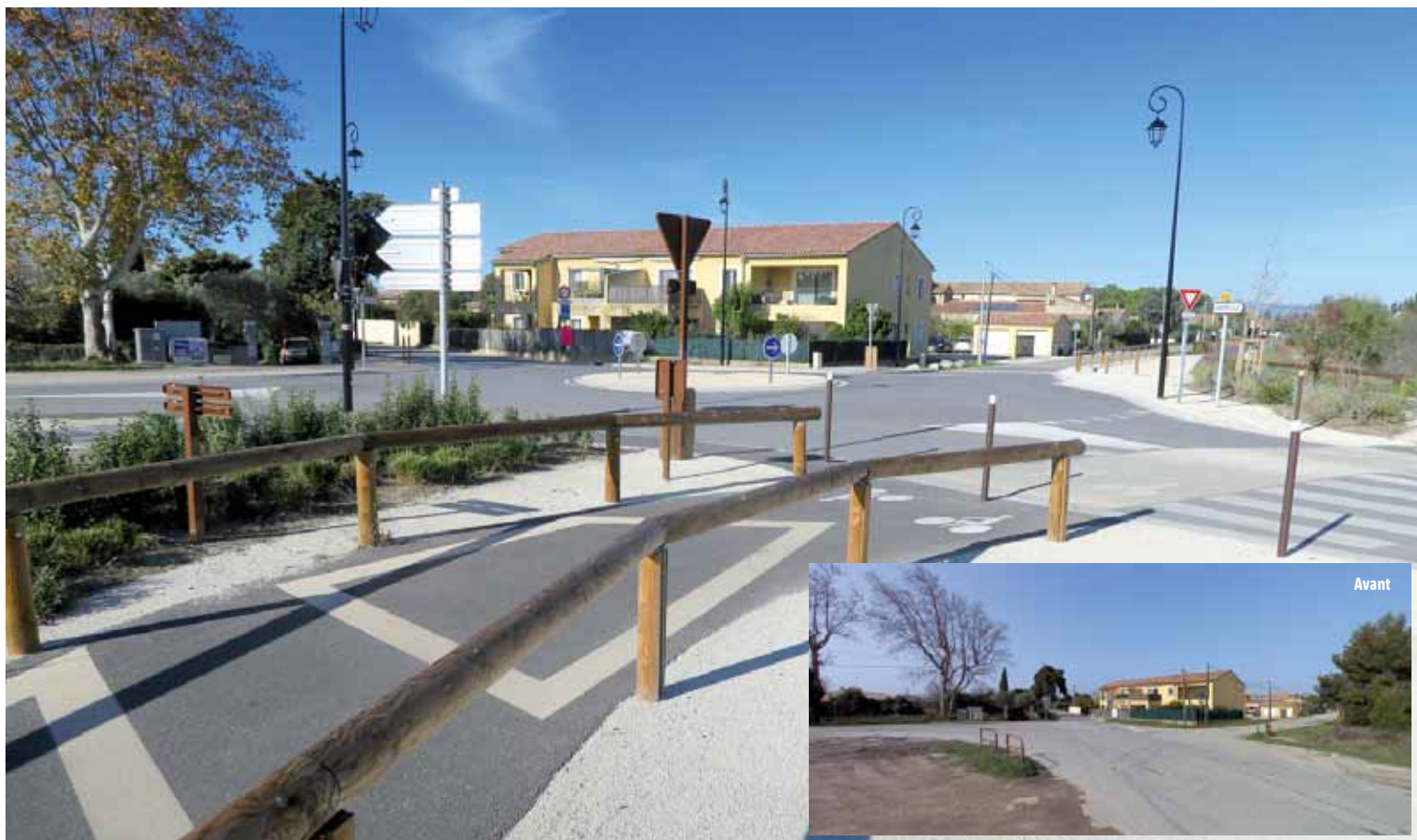
Rond point, Avenue Chabran/Route d'Althen